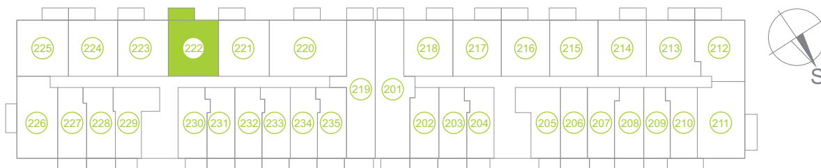
Půdorys podlaží / Floor plan